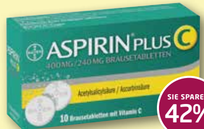
Aspirin® Plus C

Achten Sie auf weitere Angebote in unserer Apotheke!